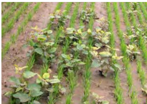
Poligono del Giappone infestante in un campo agricolo.