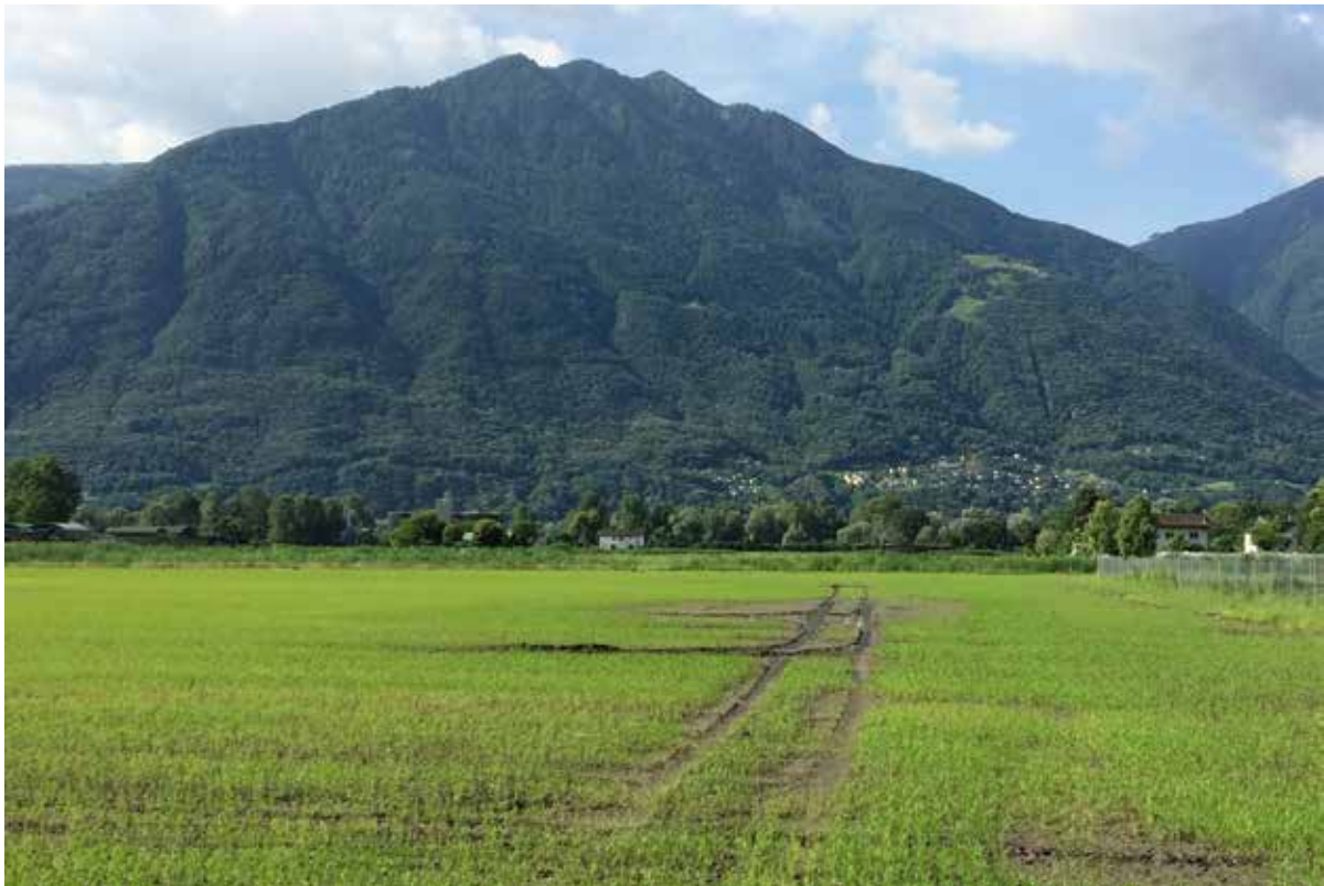
Tracce di lavorazioni in un campo agricolo.