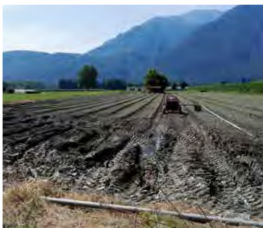
Lavorazione del suolo in condizioni di umidità non ideali.

ancora, è stato svolto uno studio specifico sulla presenza di rame nei vigneti, le cui conclusioni sono ancora attuali».